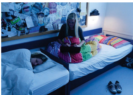
Lærerne siger godnat kl. 22.30 og der skal være ro på værelset kl. 23:00.

Lykkes det ikke, kan vi blive nødt til at afbryde vores samarbejde, og du må forlade skolen.